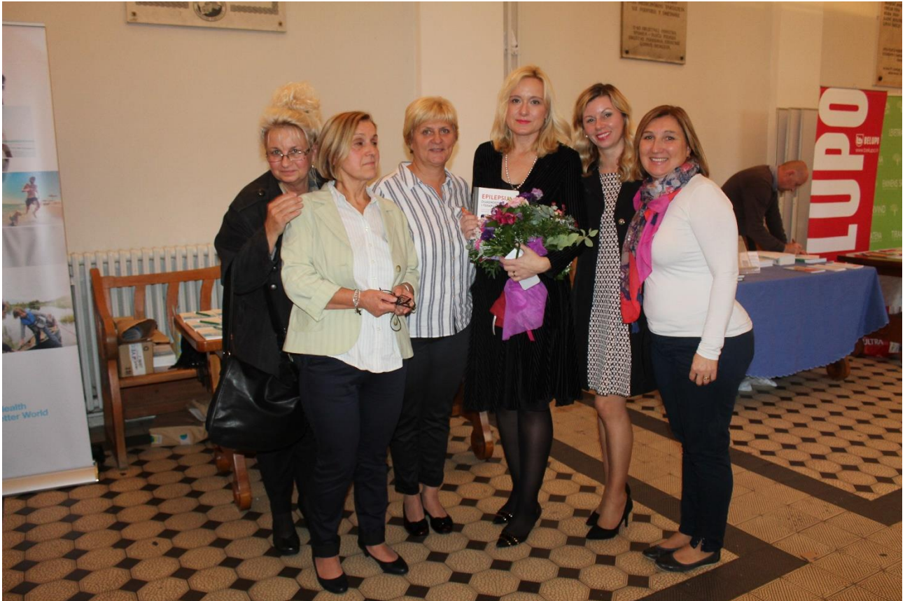
Zaposlenici Klinike za neurologiju – sudionici tečaja